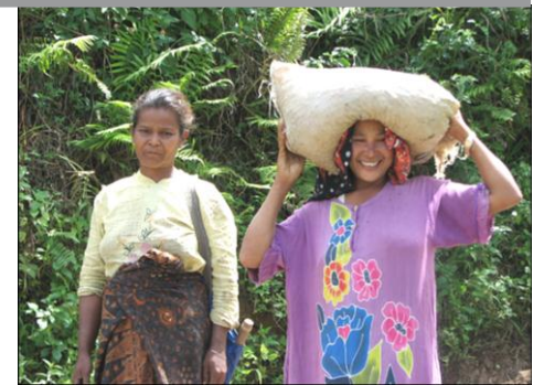
KSU Arinagata 의 생산자들

엄선된 열매들은 섬에 따라 다양한 방법으로 가공됩니다. 가장 대중적인 방법은 giling basah 라고 알려진 반-정제 가공법입니다. 생산자들은 보통 공장과 구매자들과 관계를 가지고 있는 '수집가들'에게 열매를 팝니다. 수집가들은 열매를 과육으로 만들지만 정제하지는 않습니다. 이 과정은 커피 위에 설탕(점액) 층을 남깁니다. 그 다음 후에 gabah (또는 젖은 파치먼트)라고 불리는 30-35%수분을 가진 형태로 말려집니다. 이 지점에서는 이것은 labu 가 됩니다. Labu 는 전형적인 인도네시아 커피의 전형적인 색깔인 파란색/초록색 콩으로 드러나게 됩니다.