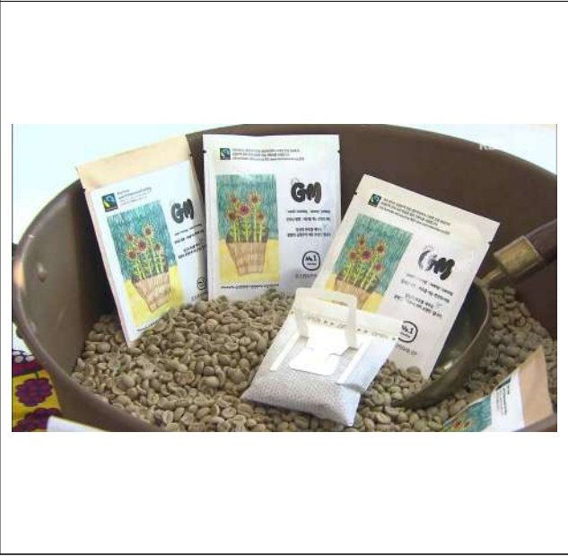
공정무역 인증 취득 진행 및 상품 개발 (커피노마드)